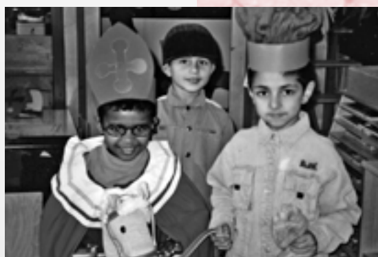
Sint en Paardenpiet