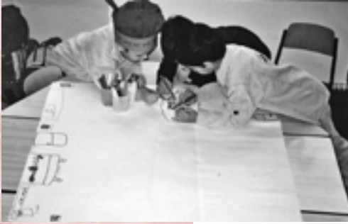
Samen werken aan de plattegrond