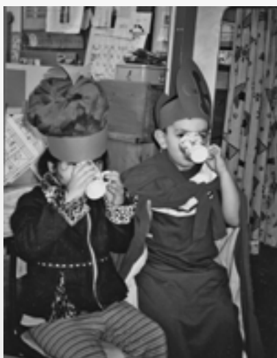
Sint en de Hoofdpiet

Na een paar dagen kunnen we een rol toevoegen, want de kinderen willen graag de Paardenpiet erbij. De Paardenpiet geeft het paard te eten en te drinken, hij ruimt de stal op, praat met Sinterklaas over wanneer hij het paard moet zadelen, borstelt het paard en gaat met Sinterklaas mee op pad. De matrix wordt aangevuld en we hebben nu vier rollen in het speelhuis.