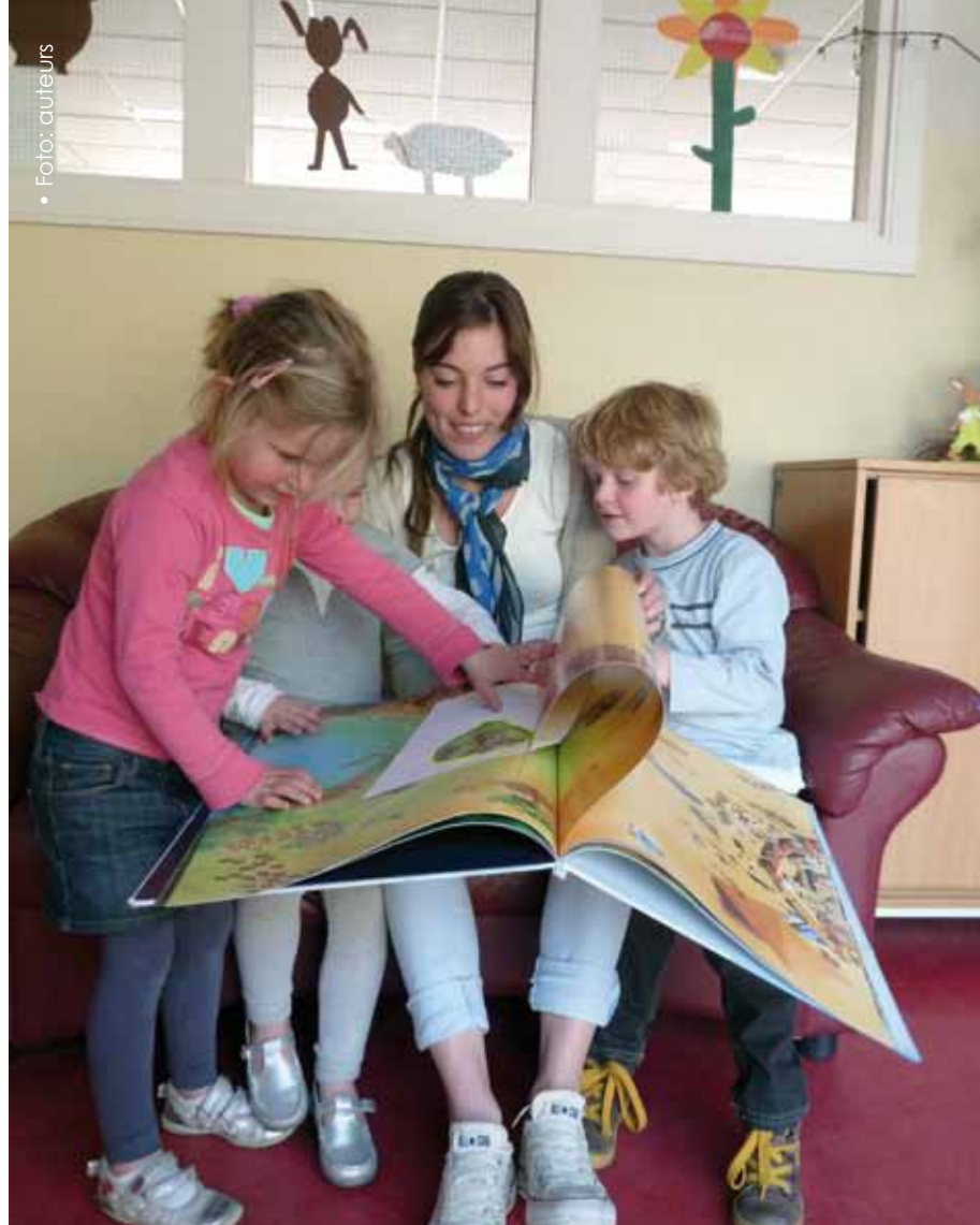
Optimale stimulatie van woordenschat aan het begin van het basisonderwijs is van essentieel belang voor de latere schoolvaardigheden

In totaal hebben we bij 48 kleuters van groep 2 van twee basisscholen de breedte- en dieptekennis van 34 vooraf geselecteerde woorden in kaart