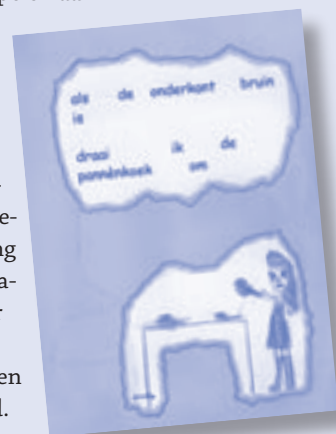
Pagina uit het Avonturijn Pannenkoekenboek